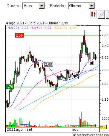
Grafico EXPRIVIA S.P.A.