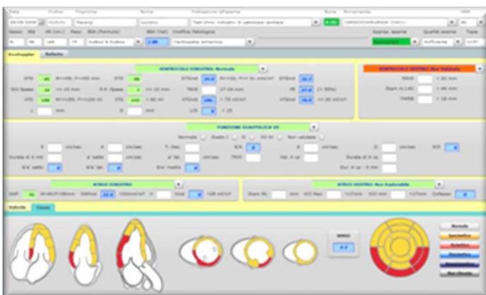
Scheda di refertazione EcoDoppler