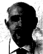
Il professore del Politecnico

1 Il declino complessivo del Paese era prevedibile. Aprendosi i sistemi produttivi come quello cinese che pratica costi bassissimi le aziende pugliesi dell'imbottito, non creando valore aggiunto, è logico che dovessero uscire dalla filiera del territorio. Oggi, comunque, si devono affrontare i riaggiustamenti dei sistemi economici.