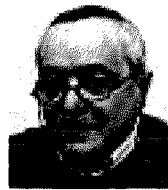
Il segretario regionale Cisl

1 Questa crisi o declino non era prevedibile. Sono rimasto sorpreso dal declassamento deciso dall'agenzia di rating, perché la Puglia, seppur con numeri limitati, è una realtà in movimento. Direi che queste società sono interessate a cercare di legittimarsi sempre di più, anche a costo di menare fendenti.