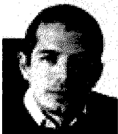
Il manager di Gts

2 Uno dei problemi di fondo ritengo derivi dalla mancanza di una politica economica unitaria, senza la quale il progetto euro risulta essere un incompiuto. In una situazione come quella attuale a pagarne le spese sono le aree periferiche ed in ritardo come il nostro Mezzogiorno.