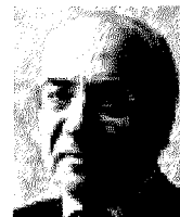
Politico e imprenditore

1 Il declino era scritto nei numeri degli ultimi dieci anni, perché come spiega Svimez: la crescita pugliese è stata inferiore a quella delle altre regioni meridionali, anche se l'immagine della Puglia era l'opposto. Al di là dei numeri, comunque, era evidente che c'era una società vispa, attenta alle novità, ma frenata.