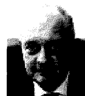
Leader comitato Banca del Sud

1 Sì, era prevedibile questa crisi. Invece non si poteva calcolare la durata della crisi stessa. Inoltre non va dimenticato che l'economia finanziaria brucia i tempi rispetto all'economia reale. Si poteva capire quanto stava accadendo perché si è cominciato a non pagare i mutui o altro ancora. I segnali erano inequivocabili.