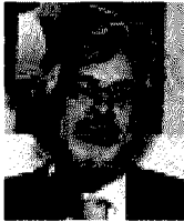
Il direttore di Banche Imprese

1 La Puglia, più di altre regioni meridionali, ha subito la crisi a partire dal 2008, a causa della sua struttura produttiva, basata sul manifatturiero e sul tessile abbigliamento calzature. La situazione di rischio era evidente, anche tenendo conto del peso della Pubblica amministrazione sul Pil meridionale, pari al 35%, rispetto al 18% delle altre aree del Paese.