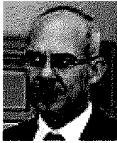
Il presidente di SXPUGLIA

2 Si sarebbe dovuti intervenire in quei territori che oggi, a livello mondiale, crescono più velocemente. E lo si può ancora fare stimolando l'aggregazione di imprese locali che, anche con la collaborazione di organismi pubblici, si conquistino spazi in quei mercati. La Regione Puglia sta facendo tanto in termini di investimenti sulle imprese, sulla ricerca e sviluppo, sul piano occupazionale. Si sarebbe dovuto e si deve lavorare per migliorare la liquidità e la