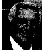
Il presidente della Cdc Foggia

2 In verità il sistema delle imprese già da alcuni anni, con l'esaurirsi della programmazione negoziata, ha avuto consapevolezza che lo sviluppo fosse legato alla capacità di rendere il territorio più attrattivo per nuovi investimenti: da lì il grande impegno su progetti infrastrutturali che hanno guardato alla logistica ed alla riqualificazione delle aree industriali. Un contesto che va tenuto in considerazione anche nel Foggiano, una realtà da sviluppare appieno.